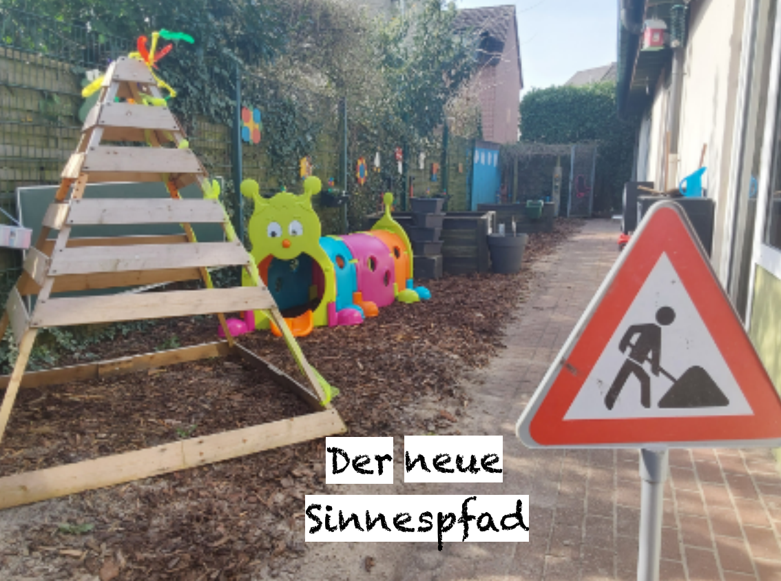
Der neue Sinnespfad

Am 29.02.2024 wurde im Evangelischen Familienzentrum Emilstraße ein Entschluss gefasst. Ein neuer Sinnespfad sollte kommen. Was anfangs wie eine Wunschidee klang, wird jetzt im Laufe der Zeit von neun Kindergartenkindern im Vorschulalter umgesetzt. Im Rahmen der Ausbildung von Kevin Lückner wurden mit diesen Kindern fünf Projekteinheiten durchgeführt. Dabei wurden vier neue Spielbereiche auf dem Sinnespfad von und mit den Kindern vorbereitet und gestaltet. Die Kinder haben ihre Wünsche und Ideen für den neuen Sinnespfad geäußert und vieles davon wurde bereits umgesetzt oder steht in Planung. Am 14.03. fand eine El-