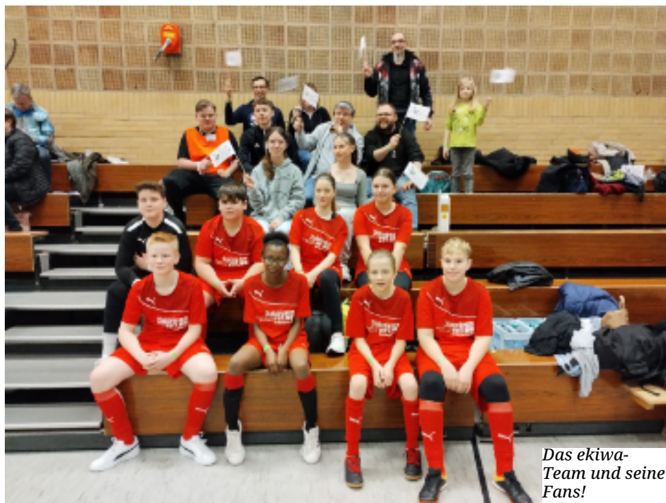
Das ekiwa-Team und seine Fans!